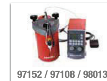
97152 / 97108 / 98013

Das System eignet sich zum Dosieren von niedrig- bis mittelviskosen LOCTITE Sofortklebstoffen in Form von Punkten oder Raupen. Es kann in automatisierte Montagestraßen integriert werden. Das Membran-Dosierventil mit Präzisions-Hubverstellung erzielt tropfenfreie Dosierung. Über das Steuergerät erfolgt die Ansteuerung von Ventil und Tank sowie die Startauslösung über Fußschalter, Tastatur oder übergeordnete SPS.