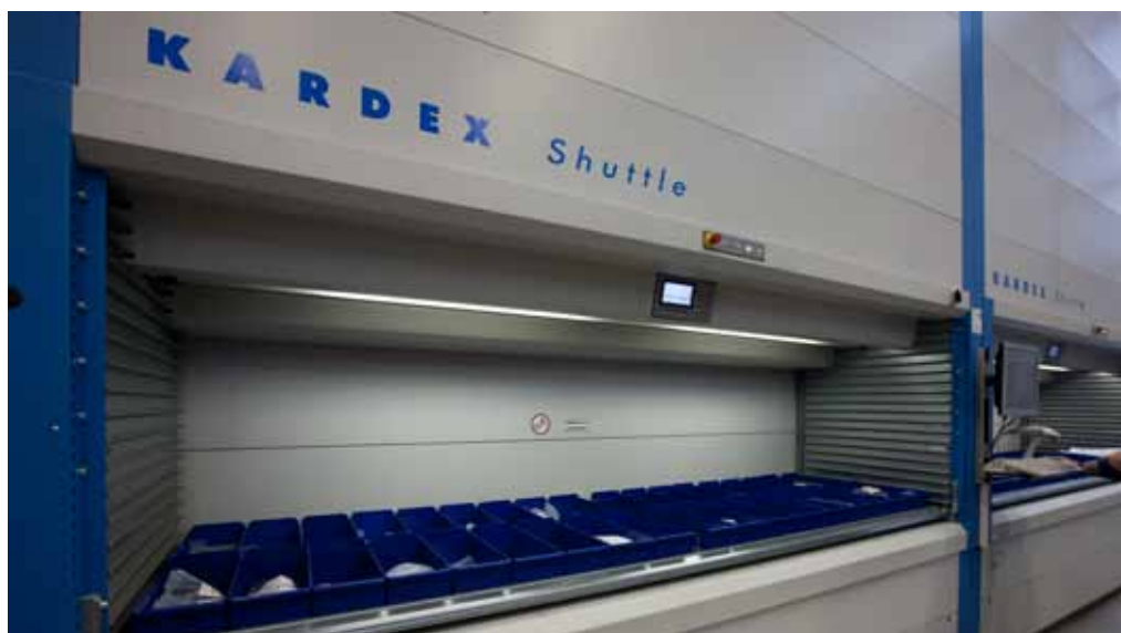
Lagerhaltung mit System